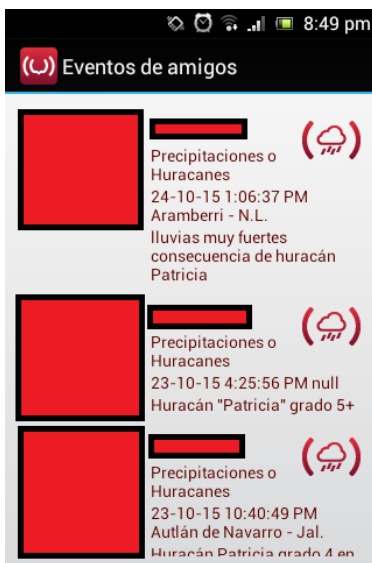
Figura 3 Pantalla de visualización de desastres publicados por contactos en redes sociales, los cuadros rojos contienen información del usuario que reporto el evento.

principalmente son causados por factores humanos, cuando los usuarios estén por reportar un desastre serán capaces de seleccionar el tipo así como su localización y de añadir una pequeña descripción, también se incluye la opción de chat usuario – usuario con el objetivo de solicitar información adicional al usuario que reporto el desastre, se agregó la opción de elegir el tipo de mapa para la visualización con el objetivo de mejorar el reconocimiento de la zona afectada, como lo son la vista clásica, con imágenes satelitales o con relieve y por último contiene los elementos que ofrece una mapa clásico de la herramienta Google Maps como el botón “mi ubicación”. Ver Fig. 4 y 5.