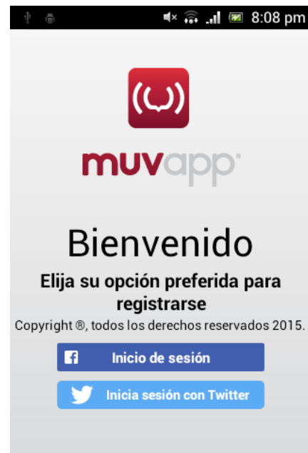
Figura 6 Ventana de bienvenida de la aplicación cliente.

Actualmente se encuentra la aplicación terminada como primer resultado, aunque todavía seguirá en fase de desarrollo para posteriores implementaciones de servicios que permitan a los usuarios detallar mejor los desastres, como una primera versión ya se encuentra disponible para descargar de manera gratuita en Google Play Store [12]. Ver Fig. 6.