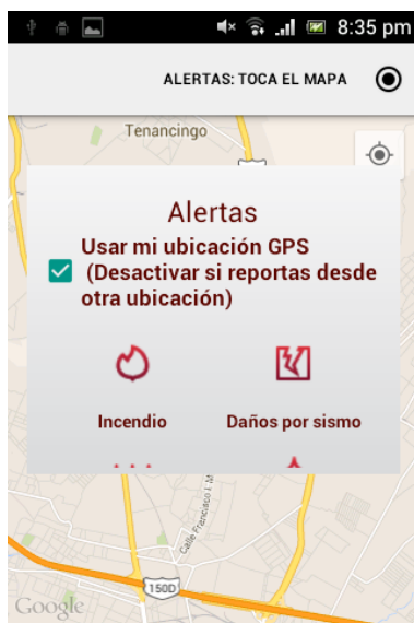
Figura 4 Visualización de ventana de selección del reporte de desastres.