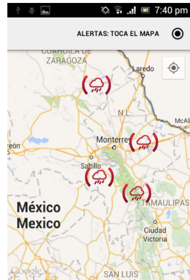
Figura 5 Visualización de los desastres en el mapa.