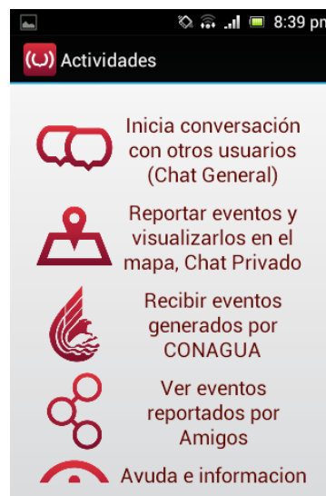
Figura 2 Pantalla de actividades de la aplicación.

El registro del usuario se hace con la red social de su elección, Facebook o Twitter , por el momento se tiene solo estas 2 opciones, pero se tiene contemplado agregar más redes sociales, ya que esta característica es una de las que potencian la comunicación de la información que pretende la aplicación propagar. En la aplicación cliente existen 4 principales características que se describen a continuación. Ver Fig. 2.