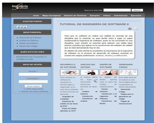
Figura 1 Página Principal del tutorial.

A continuación, se muestra la página principal del tutorial.