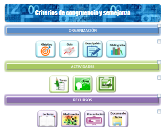
Figura 4 Contenido de cada unidad.