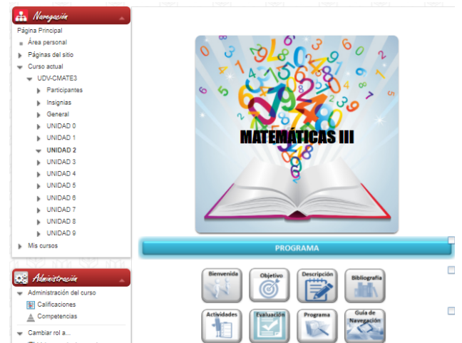
Figura 2 Administración del curso.

En la página principal del curso de matemáticas III, se encuentra el programa el cual contiene: la bienvenida, objetivo, descripción, bibliografía, actividades, evaluación, programa, guía de navegación. Como se observa en la Fig. 1.