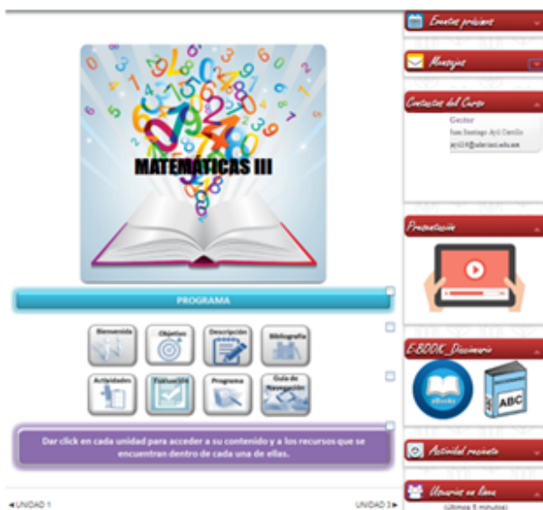
Figura 5 Calendario, actividades, e-book, entre otros.

Mientras el alumno continua navegando en el entorno, al posicionarse en el cursor en la parte izquierda de la página principal, podrá tener acceso a un calendario donde se muestran los eventos próximos, mensajes, contactos del curso, video de presentación, E-BOOK y diccionario (Fig. 5), así como la actividad reciente y los usuarios que se encuentren en línea.