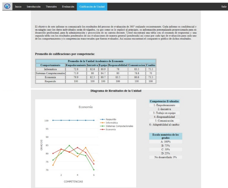
Figura 5. Resultado global de la evaluación docente.