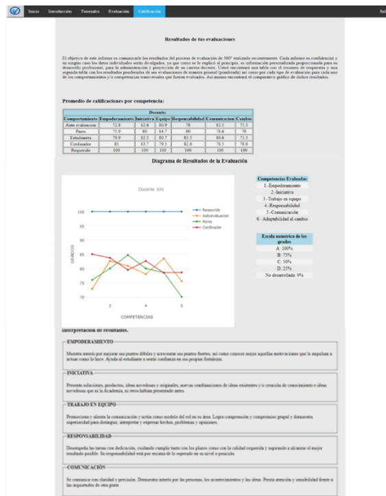
Figura 4 Resultado individual de la evaluación docente.